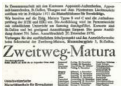
Insertat für Orientierungsabende der OME

Wer heute in der Ostschweiz als Erwachsener die Matura nachholen möchte, hat mit der ISME eine etablierte Adresse. Das war nicht immer so. Bis in die späten 1960er-Jahre existierte in der Region kein entsprechendes Angebot. Wer die Matura auf dem zweiten Bildungsweg anstrebte, musste auf Privatschulen wie die Juventus oder die AKAD, beide in Zürich, ausweichen. Eine staatliche Schule in erreichbarer Nähe suchte man vergebens.